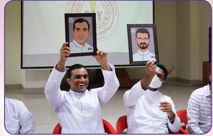
Fiesta 2021 (Youth Day)