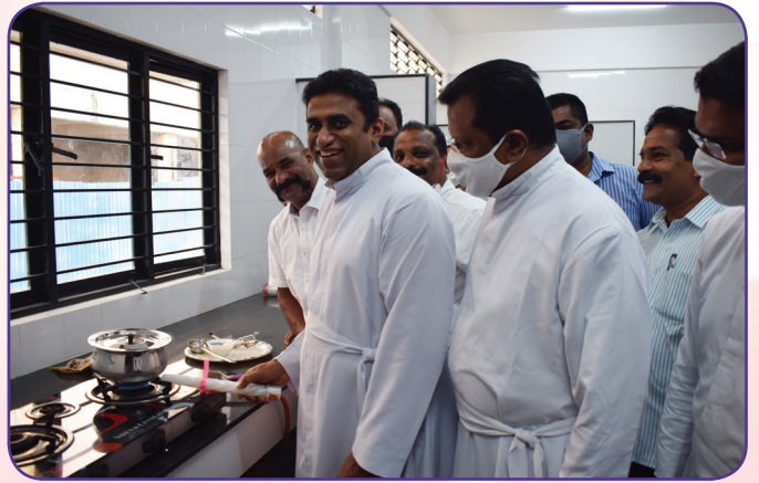
Kitchen & Guest Room Block - Blessing & Inauguration