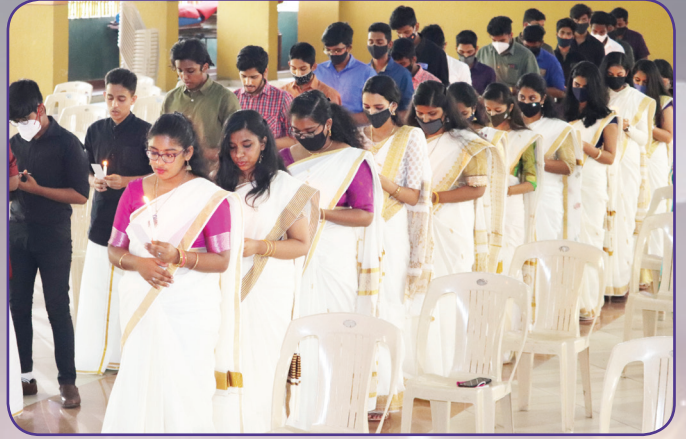
Catechism STD XII farewell